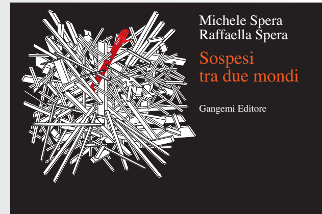
Sospesi tra due mondi, Mostra fotografica a cura di Michele e Raffaella Spera Dal 27 marzo