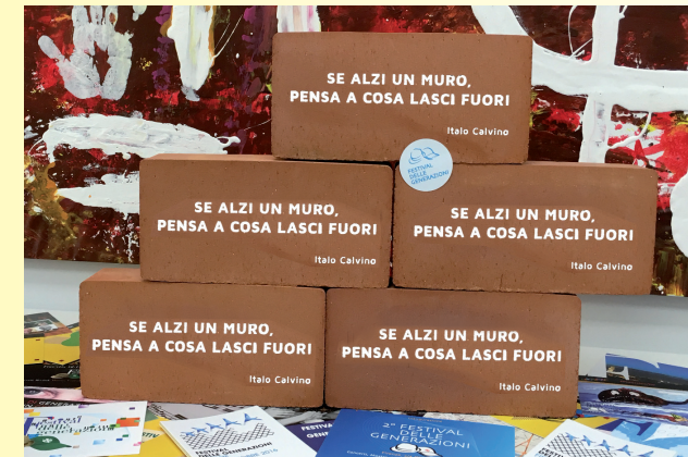
Se alzi un muro, pensa a cosa lasci fuori Italo Calvino