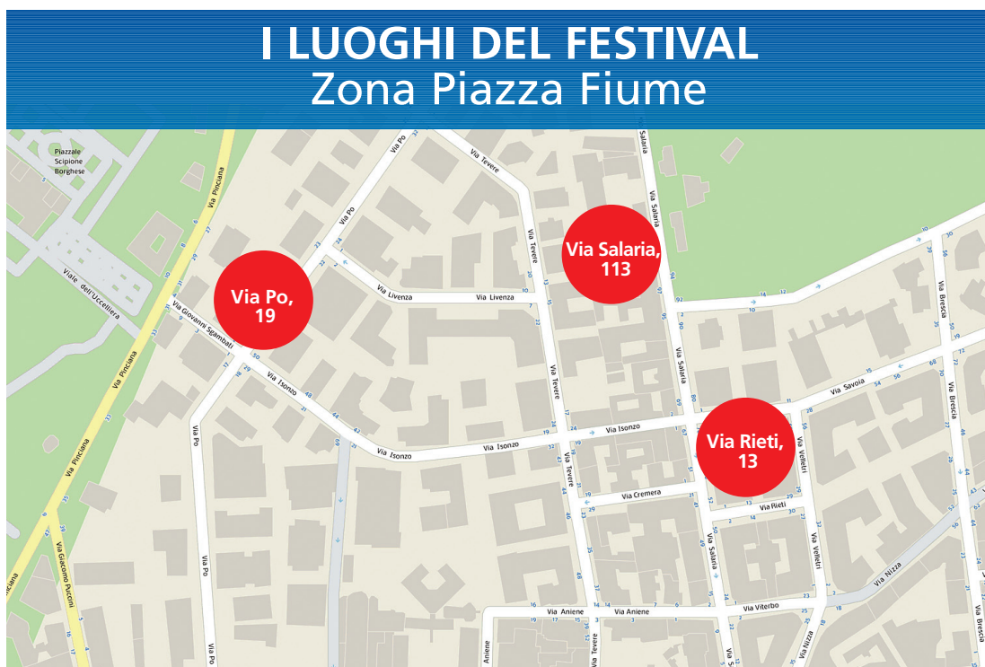
I LUOGHI DEL FESTIVAL Zona Piazza Fiume